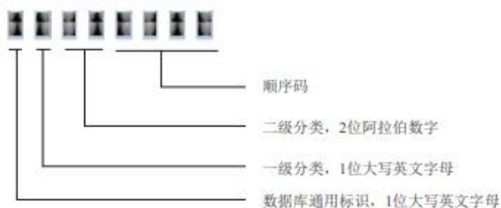
图2 数据元标识符结构